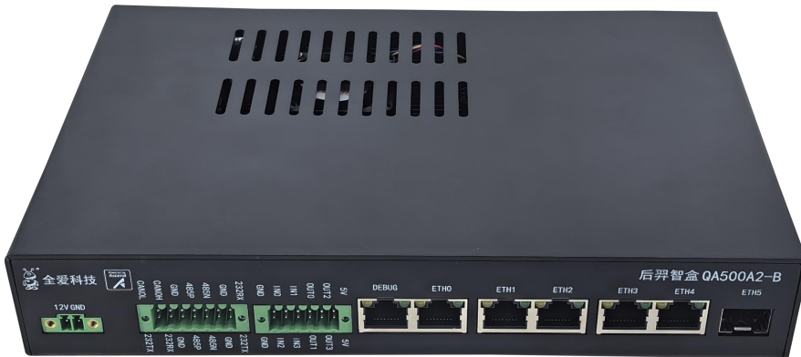
图 1-4 按键与接口说明