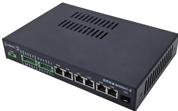
图 1-1 外观图 A