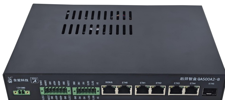
图 1-2 外观图 B