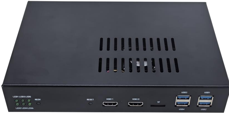
图 1-5 按键与接口说明